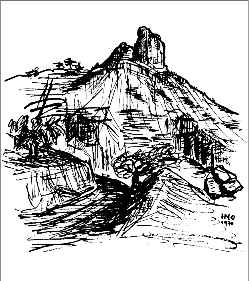
Roque Bentaiga, Gran Canaria (Zeichnung: Herbert Nowak 1970)

Anmerkung der Redaktion: Der Bentaiga-Felsen (Name aus der Sprache der Ureinwohner) ist ein Höhenheiligtum der Altkanarier von Gran Canaria. Zu beobachten ist ein Kultplatz mit Libationsrinnen sowie libysch-berberische Felsinschriften. Beides hat vermutlich nicht das gleiche Alter; die jüngeren Inschriften, die noch nicht befriedigend gelesen bzw. übersetzt wurden, könnten aber ebenso einen Bezug zur Wertigkeit des Felsens als hochgelegener, numinoser Platz haben. hju 2009